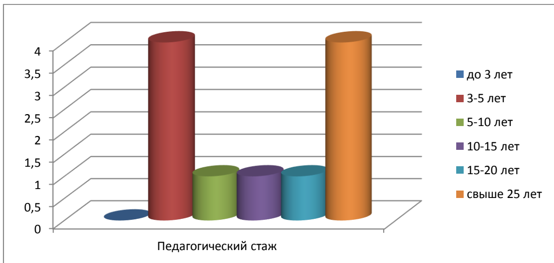
Таблица 2. Квалификационные категории педагогических работников.