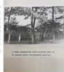
моя родная земля

В 1829-ом началось заселение земля, расположенная ныне по течению реки Подушок. Там поселился хутор Ново-Георгиевский, а позже Чурбан на том месте, где расположена станция, ах хутор болоток назывался Афанасий Чурбан, знаменитая хлебобулочным овладением.